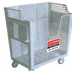
2.200 Liter Gaaskooi