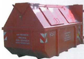
Gesloten 9 m³