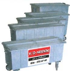
500 - 1.600 Liter