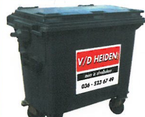
660 - 1.100 Liter