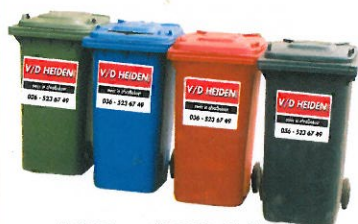
120 - 360 Liter